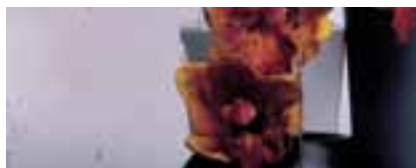
SGG ALTDEUTSCH F = coefficient 10

Il est basé sur la reconnaissance d'un même objet placé derrière les différents vitrages de la gamme SGG DECORGLASS, à une distance toujours équivalente et sous un éclairage similaire.