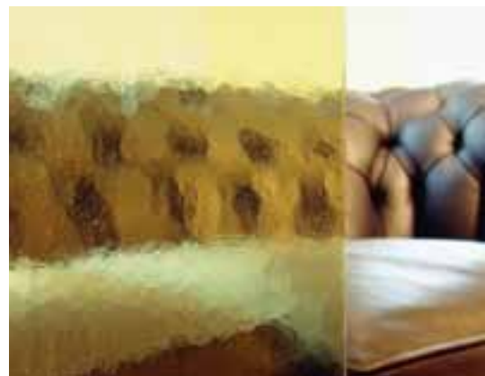
SGG KATHEDRAL MIN