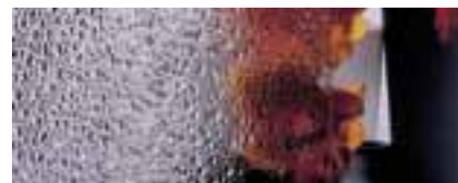
SGG WATERDROP = coefficient 1