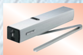
Opérateur de portes battantes