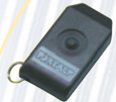
Commande par clé infrarouge