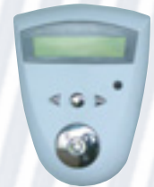
Console de pilotage