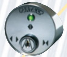
Sélecteur à clé