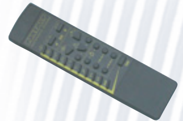
Télécommande infrarouge multifonctions